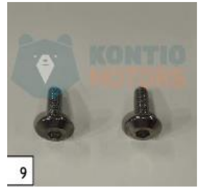
Ohjaustanko ja mittaristo osittain irti. Mittariston kiinnikeruuvit. (kuva 9).