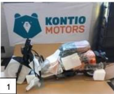
1 Kruiser Vesper runko osittain kasattuna. (kuva 1) Tarkista tehdas kiinnitteisten osien kiinnitykset.

Irto-osissa voi olla poikkeavaisuuksia riippuen valmistuserästä. Asennusohjeessa on käytetty Kontio Cruiser Elektraa , joten ohjeessa voi olla poikkeavuuksia. Kontio Cruiser Vesperin suojaamiseksi kuljetuksen aikana laite toimitetaan osittain kasattuna. Asenna ajoneuvo käyttövalmiiksi seuraavien ohjeiden mukaisesti. Avatessasi pakkausta varo, että pakkaus ei puhkea, jottei sisältö vaurioidu. Kun olet avannut paketin, tarkista, että seuraavat osat ovat mukana: