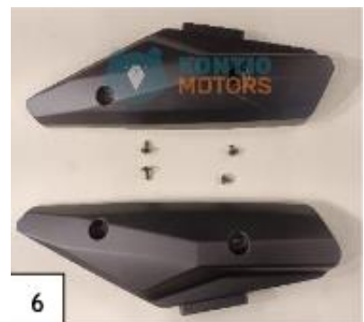
6 Kylkipaneeli. (kuva 6).