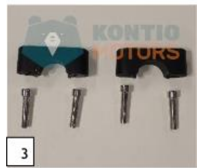
3 Tangon kiinnikkeet ja kiinnikeruuvit. (kuva 3).