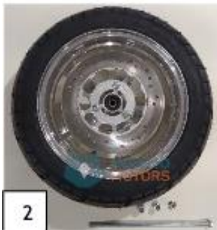
2 Eturengas ja etuakseli. (kuva 2).