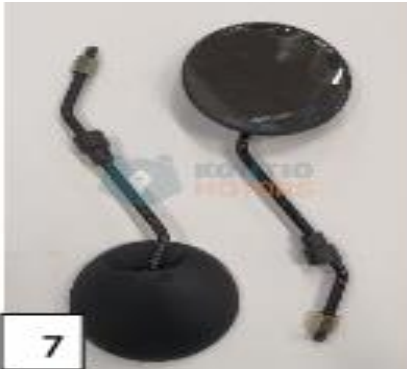
Peilit. (kuva 7).