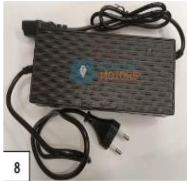
Laturi. (kuva 8).