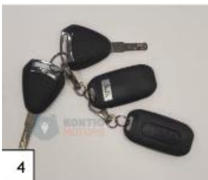
4 Avaimet. (kuva 4).