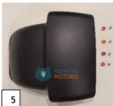
5 Etulokasuoja. (kuva 5).